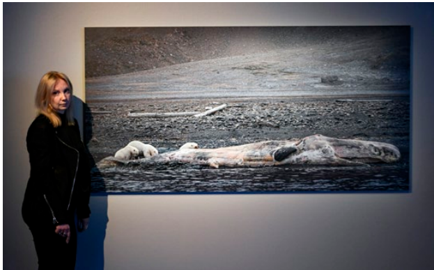
En isbjörnhona med två ungar äter av det ruttnande kadavret efter en kaskelot. "Isen har försvunnit så isbjörnarna tvingas äta rutten fisk eftersom de inte längre kan jaga ute på isen", säger Ursula Sepponen som fotograferade scenen på Svalbard.